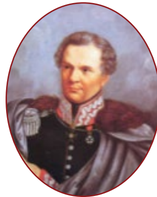
generał Jan Skrzynecki