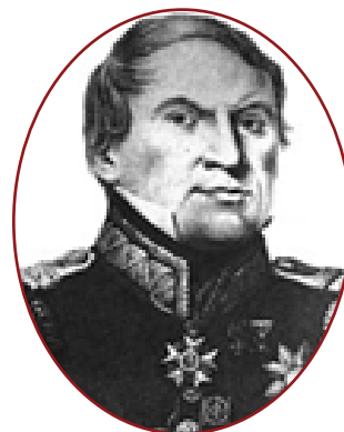
generał Jan Krukowiecki