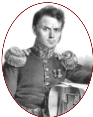
generał Maciej Rybiński