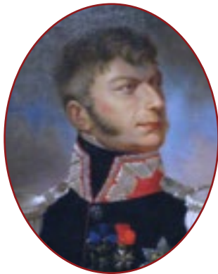
generał Józef Chłopicki

Dopasuj postaci z obrazków poniżej do poszczególnych wersów wierszyka.